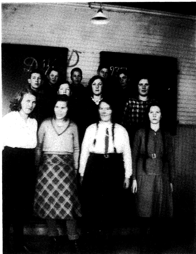
Fortsättningsskolan 19 jan. 1933